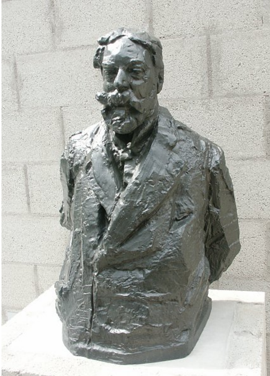
BUSTE van JAMES ENSOR, 1913 Rik Wouters